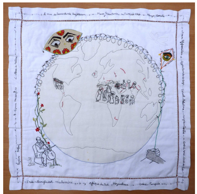
Nous sommes tous des migrants sur notre terre oeuvre de Michèle Hochard