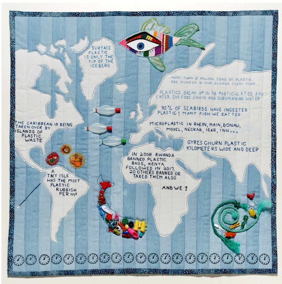
Où est passé tout le plastique ? œuvre de Lisa-Marie Röhrl