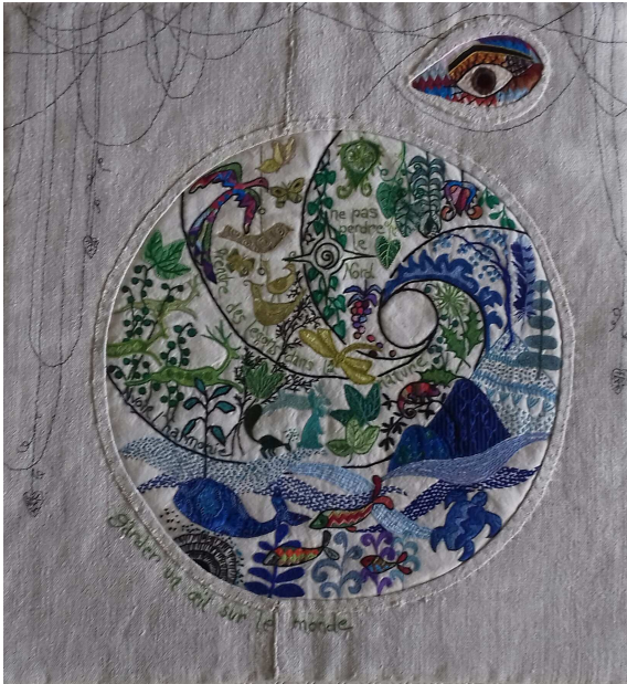
Aime ta planète œuvre de Dolorès Alarçon