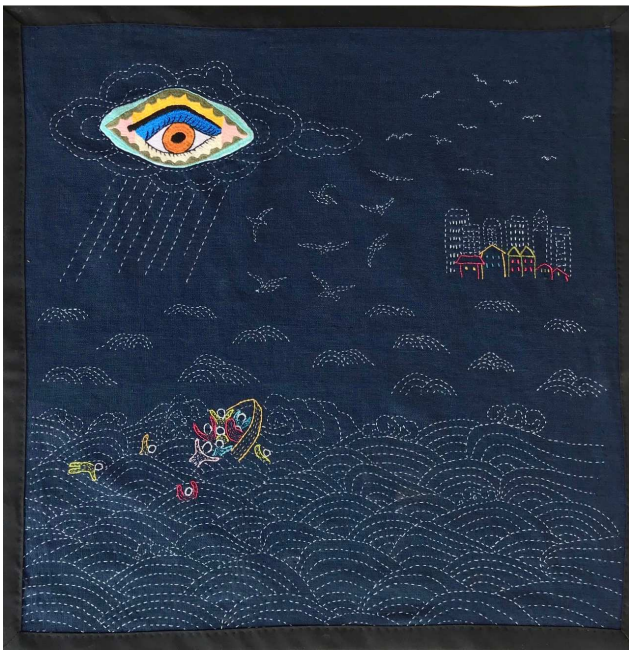
Les rêveurs de liberté oeuvre de Phong Coulot