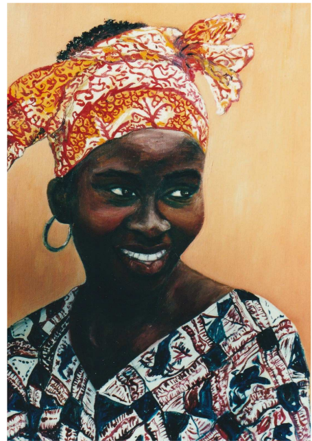
Peinture de Jocelyne Prin