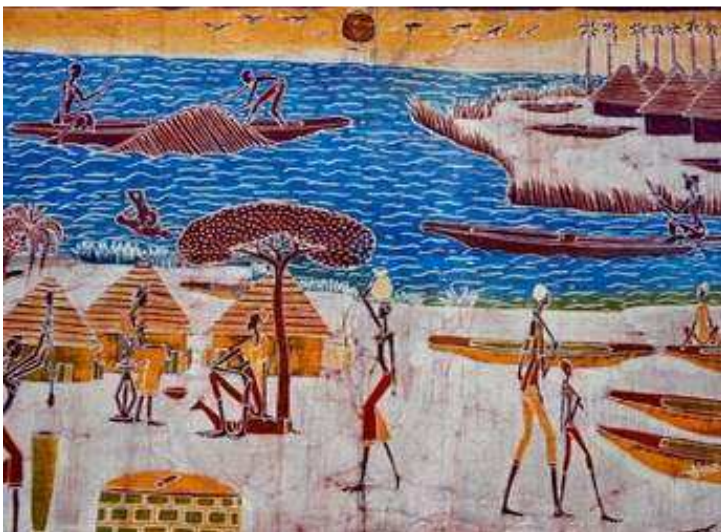
Batik d'Abou Ouedraogo